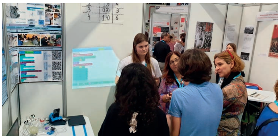
FIGURA 3. Visita del jurat a l'estand.

CLÀUDIA: Sense l'Ivan no hauríem pogut fer res. ■